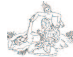
Masseur « Thaï traditionnel »